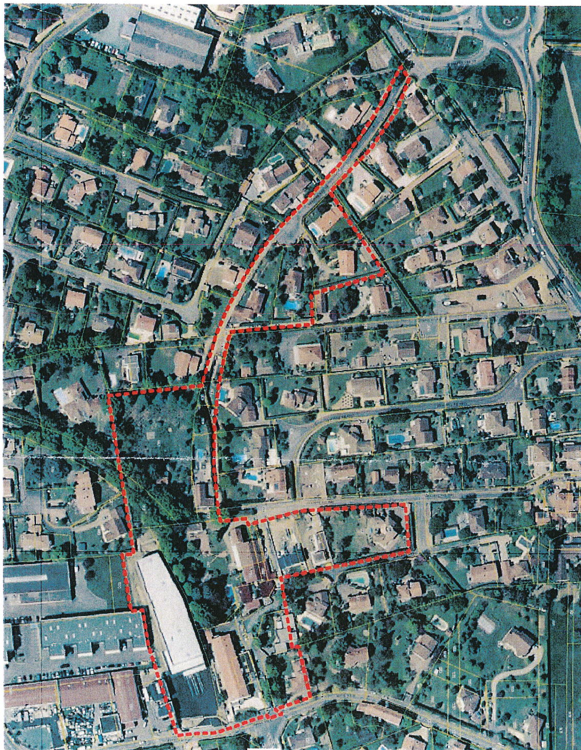
ANNEXE 3 : proposition de périmètre d'interdiction