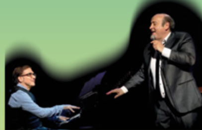
ART FM Production / © Didier Jallot

Samedi 10 - 20h : Fados e Canções avec Michel Costa salle d'animation de Sainte-Consorce