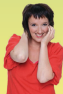
Philippe Vallant Spectacles et Polyfolies