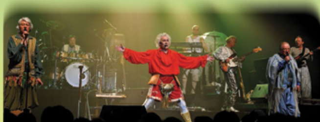
ipetit Production / © Eric Doll