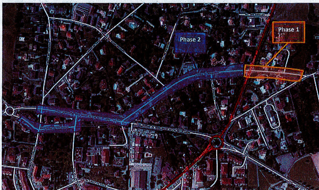
Phasage des travaux

4/- Mise en séparatif de la partie Amont du chemin du Ravagnon (jusqu'à la route du Col de la Luère), par la création d'un nouveau réseau public d'assainissement en fonte de diamètre 200 mm sur un linéaire de 269 mètres linéaires, y compris la reprise des branchements et la réutilisation du réseau unitaire en réseau public d'eaux pluviales ; une partie du réseau unitaire affecté à la gestion des eaux pluviales doit être renouvelé (65 mètres linéaires de réseau public Eaux Pluviales).